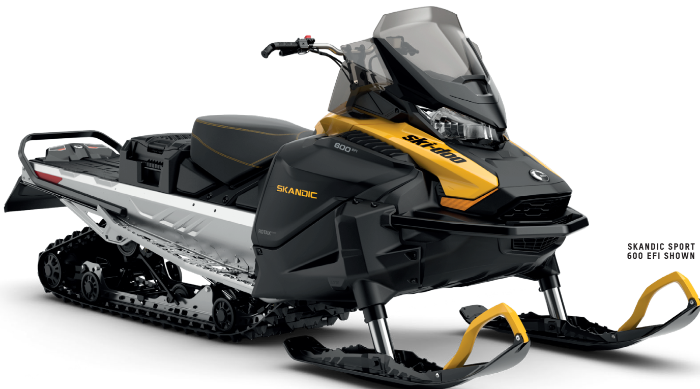
SKANDIC SPORT 600 EFI SHOWN