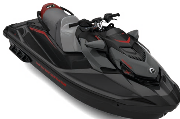
НОВИНКА Eclipse Black и Deep Marsala